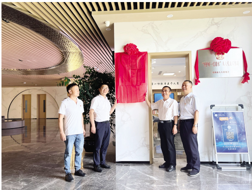
君山区 12345 热线代表通道揭牌

工作站建立以来,紧扣生态环保主题,在代表履职、代表活动上做到常态长效。该工作站由代表工作室、12345代表热线服务点、代表培训中心、代表研学点、代表综合办公区和代表直播间等六大部