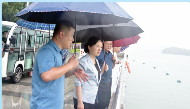
驻区人大代表开展“守护好一江碧水”微监督活动

言民意 梳理群众热点诉求，适时召开“民情恳谈会”，会商各类民生诉求问题的解决方案和落实措施，对重大事项和热点问题，集体研究后，转化为人大代表建议件，在大会提交，并进行跟踪督办。