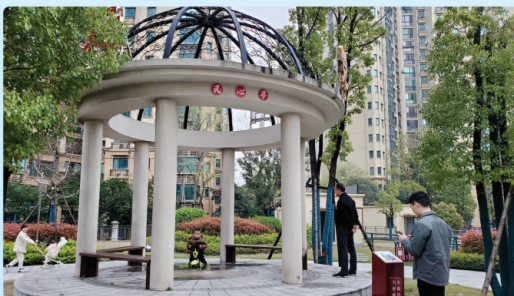
在住宅小区和党建公园开设民心亭通过二维码征求群众意见

言民意 梳理群众热点诉求，适时召开“民情恳谈会”，会商各类民生诉求问题的解决方案和落实措施，对重大事项和热点问题，集体研究后，转化为人大代表建议件，在大会提交，并进行跟踪督办。