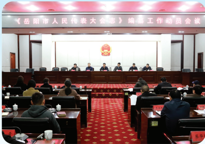
3月24日岳阳人大志编纂工作动员会举行