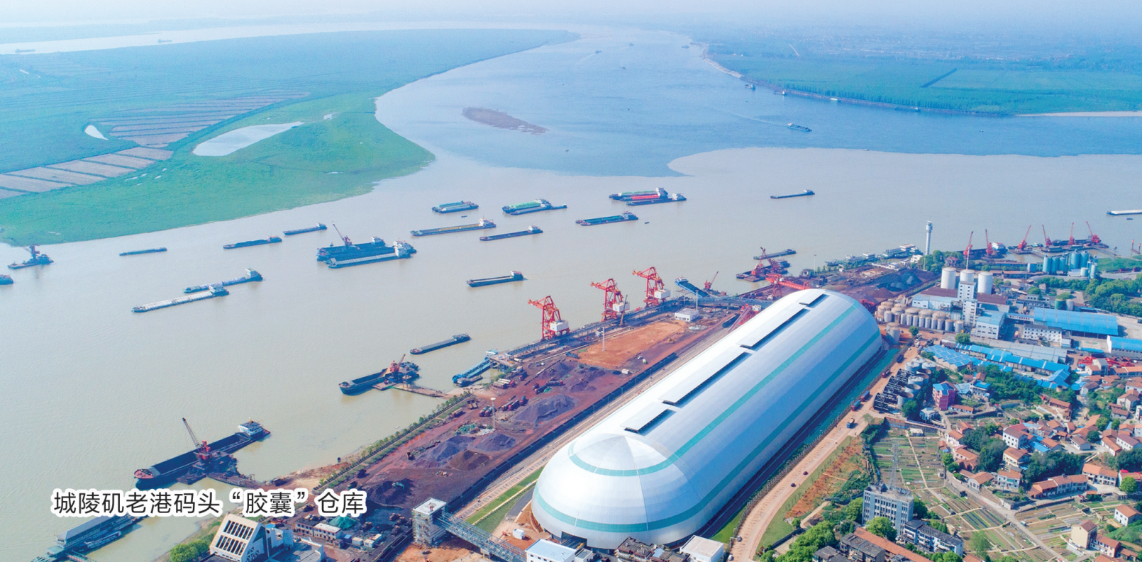
城陵矶老港码头“胶囊”仓库

2023年是贯彻落实党的二十大精神开局之年，城陵矶新港区将高举习近平新时代中国特色社会主义思想伟大旗帜，全面贯彻落实党的二十大精神和中央、省委、市委经济工作会议精神，坚定扛牢“对外开放桥头堡、经济发展增长极”使命任务，增强历史主动、发扬斗争精神、坚守奋进“十律”，立足新港区经济发展主要矛盾新形势新变化，推进园区由开发建设向精细运营、由“单向输血”向“培育反哺”、由数量增长向量质齐升蜕变。通过大力实施“产业能级跃升工程”“开放发展攀高工程”“企业服务提质工程”“改革创新示范工程”“党的建设引领工程”五大工程，全面建设“五好园区”，奋力谱写城陵矶新港区在新征程高质量跨越式发展新篇章。2023年城陵矶新港区将奋力实现完成GDP370亿元；固定资产投资300亿元；进出口贸易额700亿元；全口径税收40亿元，地方财税收入10亿元；完成合同引资额500亿元，城陵矶港集装箱吞吐量确保完成120万标箱，力争达到150万标箱。以“区队”为全市、全省在区域竞争大格局中当先锋、挑大梁、作贡献。