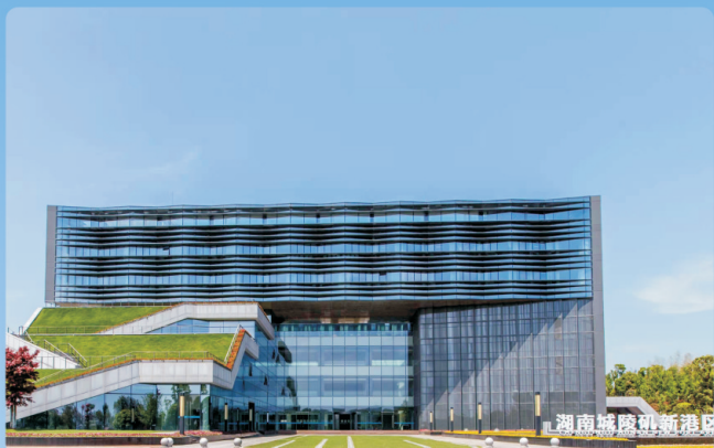
城陵矶新港区通关服务中心