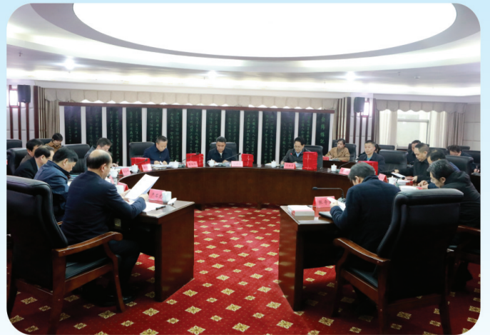
3月24日召开全市人大系统信息调研工作座谈会