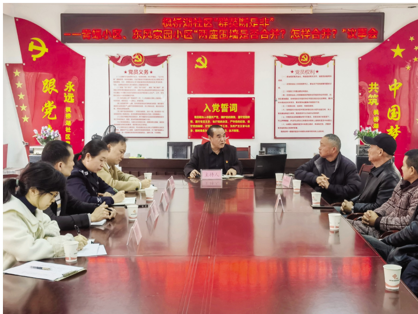
岳阳楼区人大代表参加枫桥湖街道“群英断是非”工作

“群英断是非”工作法的核心思想是一切为了人民、一切依靠人民,通过人民的智慧去评判是非曲直,从而最终实现全过程人民民主。这种工作法强调通过多方面、全方位的信息搜集和评估,以更科学、公正的方式让决策过程变得透明,并且真正反映人民意愿。