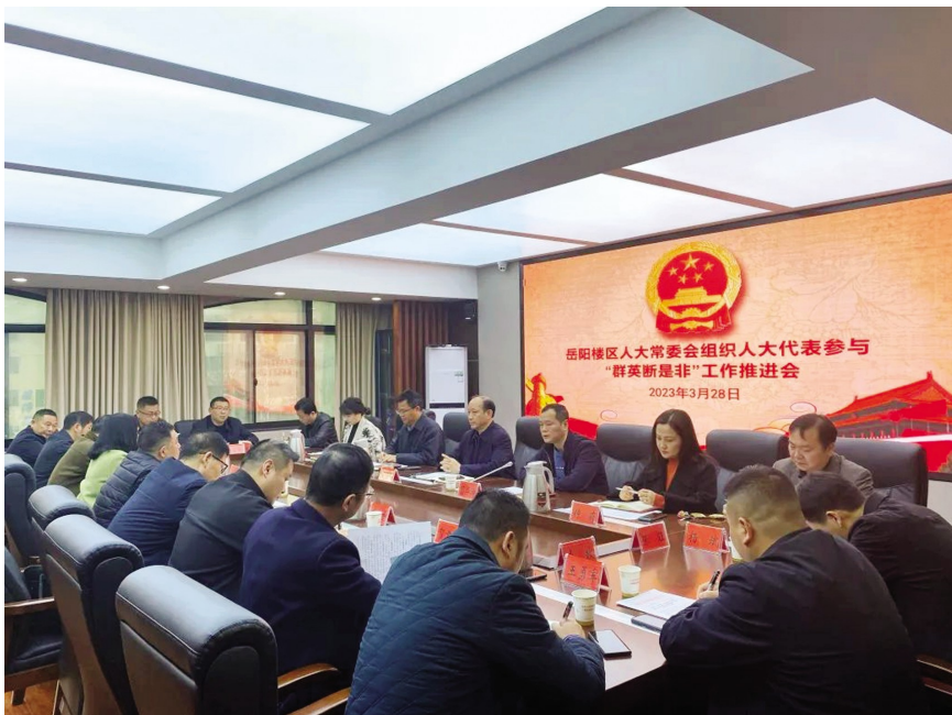
岳阳楼区人大常委会召开组织人大代表参与“群英断是非”工作推进会

在当下,岳阳楼区在实践过程中首创提出“群英断是非”工作法,即在基层党组织领导下,给群众赋权,让群众“当家”,巧用群众身边贤达的“影响力”,发挥职能部门的“专业性”,让“群英”共评、共商、共断群众不同诉求的“是与非”,凝聚共识,有效解决基层治理“疑难杂症”的工作方法。“群英断是