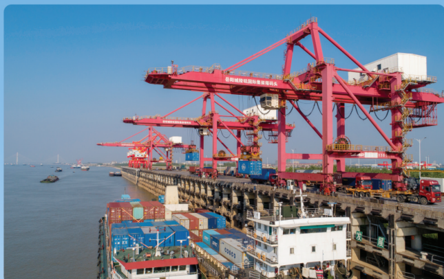
城陵矶国际集装箱码头

2023年是贯彻落实党的二十大精神开局之年，城陵矶新港区将高举习近平新时代中国特色社会主义思想伟大旗帜，全面贯彻落实党的二十大精神和中央、省委、市委经济工作会议精神，坚定扛牢“对外开放桥头堡、经济发展增长极”使命任务，增强历史主动、发扬斗争精神、坚守奋进“十律”，立足新港区经济发展主要矛盾新形势新变化，推进园区由开发建设向精细运营、由“单向输血”向“培育反哺”、由数量增长向量质齐升蜕变。通过大力实施“产业能级跃升工程”“开放发展攀高工程”“企业服务提质工程”“改革创新示范工程”“党的建设引领工程”五大工程，全面建设“五好园区”，奋力谱写城陵矶新港区在新征程高质量跨越式发展新篇章。2023年城陵矶新港区将奋力实现完成GDP370亿元；固定资产投资300亿元；进出口贸易额700亿元；全口径税收40亿元，地方财税收入10亿元；完成合同引资额500亿元，城陵矶港集装箱吞吐量确保完成120万标箱，力争达到150万标箱。以“区队”为全市、全省在区域竞争大格局中当先锋、挑大梁、作贡献。