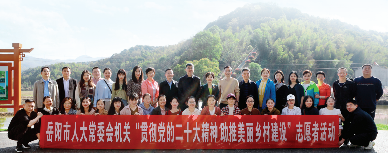
3月15日，市人大常委会机关组织开展“贯彻党的二十大精神助推美丽乡村建设”志愿者暨主题党日活动。市人大常委会主任马娜，市人大常委会副主任李永丰、刘晓英、黄俊钧、喻文，市人大常委会秘书长汪四新参加。