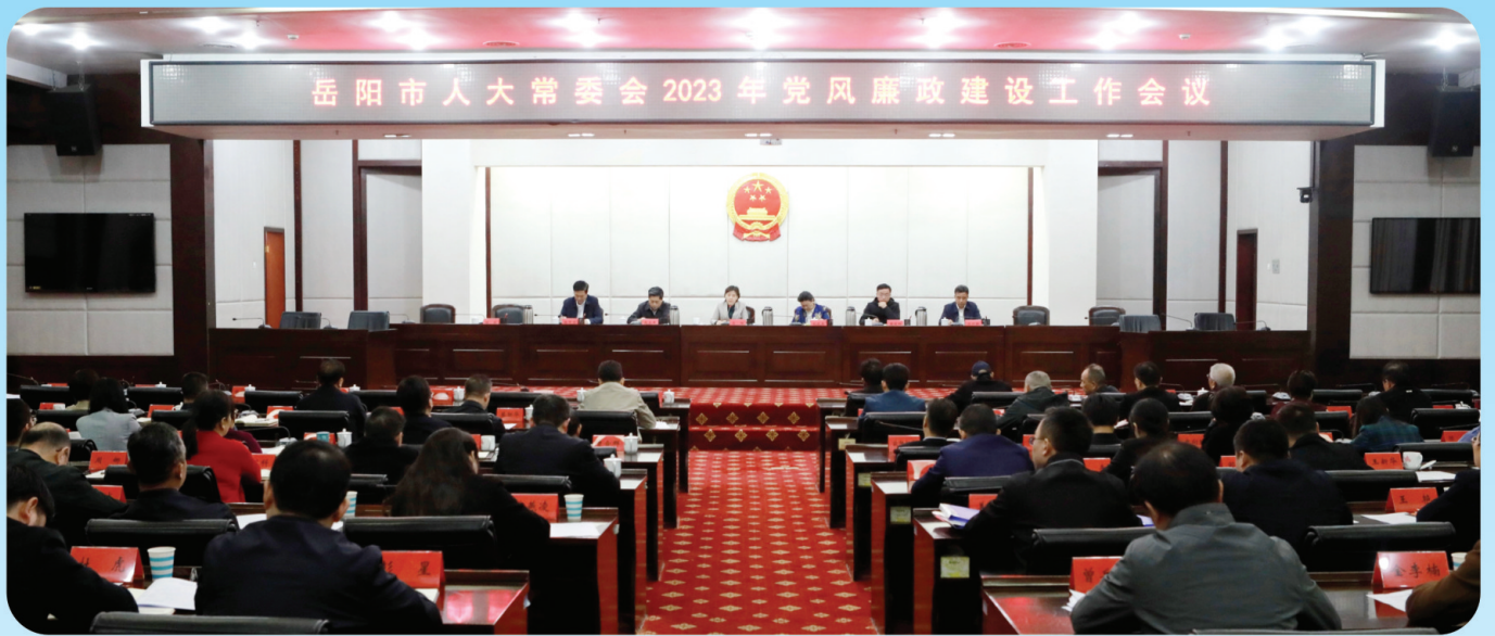
3月6日市人大常委会2023年党风廉政建设工作会议召开