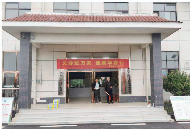
三湘农民健康行活动现场

为确保活动质量,华容县人大教科文卫委结合实际,精心调度,派出健康行专家及护理人员团队送医送药送健康下乡。医疗队按照优势互补原则