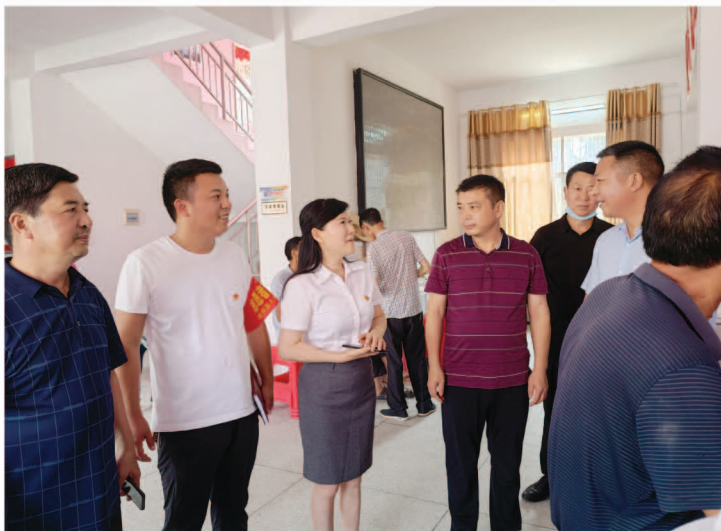
毛田镇珠港村义诊

近几年，根据分管工作的调整，她积极钻研学习其他大型综合医院先进管理经验，先后完善了医