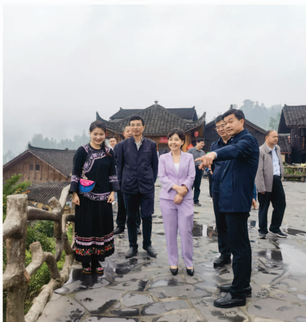
调研组在十八洞村调研

2022年换届以来,州人大常委会坚持党的领导,聚焦中心大局,聚情民生关切,聚合代表力量,聚力依法履职,人大各项工作稳步推进、创新发展。湘西州人大常委会先后在省委贯彻落实中央人大工作会议精神推进会、全州市州县人大常委会主任研讨班等会议上作典型发言,相关工作经验得到高频次推介。