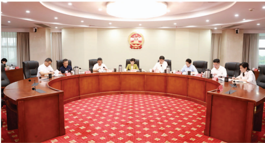
市人大常委会机关召开青年干部座谈会

今天是五四青年节,在这个充满希望、充满梦想、充满活力的日子里,很高兴与大家一起座谈交流,这体现了市人大常委会以及机关两级党组对青年工作的重视和关心。从大家的发言中,我感受到了青年作为最积极最活跃最有生气的力量,不愧是党和国家事业发展的生力军;人大青年富有青春活力、境界抱负,不愧是值得信赖、值得依靠的人大事业发展的生力军和中坚力量!