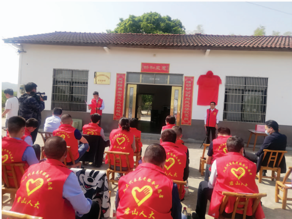
君山区“人大代表+点式养老”志愿服务站挂牌

益严重的养老问题考验着政府规划养老的能力,近年来从中央到地方都出台了一系列养老惠老政策,可在实际操作过程中还有很多误区和执行障碍。如何将资金、项目整合到养老服务设施建设和养老服务体系完善中就存在一定的阻力,还有待进一步完善机制;如何打通政策执行中的堵点、畅通资金拨付渠道,还有待进一步深入研究。如许市镇横山岭村设有