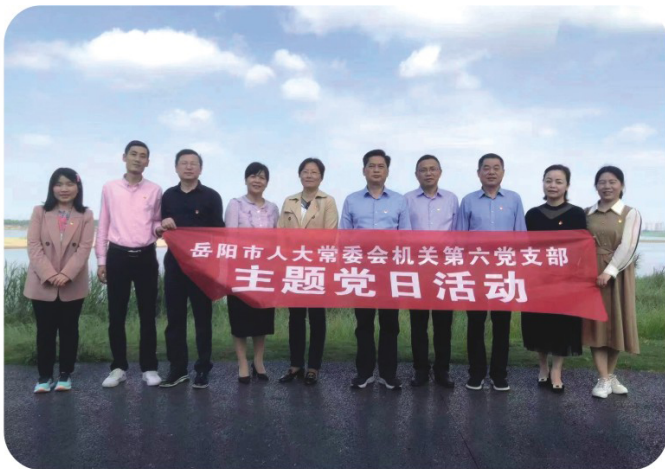
岳阳市人大常委会机关第六支部开展清廉文化主题党日活动