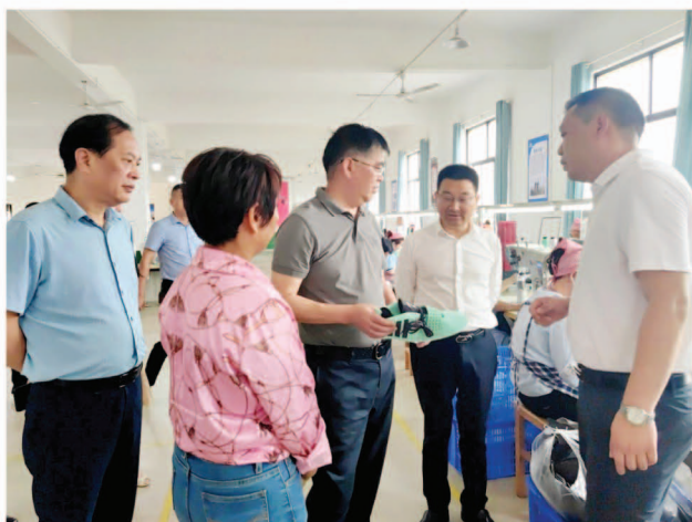
李永丰(右3)一行走访基层人大代表

5月19日,市人大常委会副主任、党组副书记李永丰带队赴岳阳县调研“六员六结合”工作。市人大常委会联工委、岳阳县人大常委会负责人参加调研。