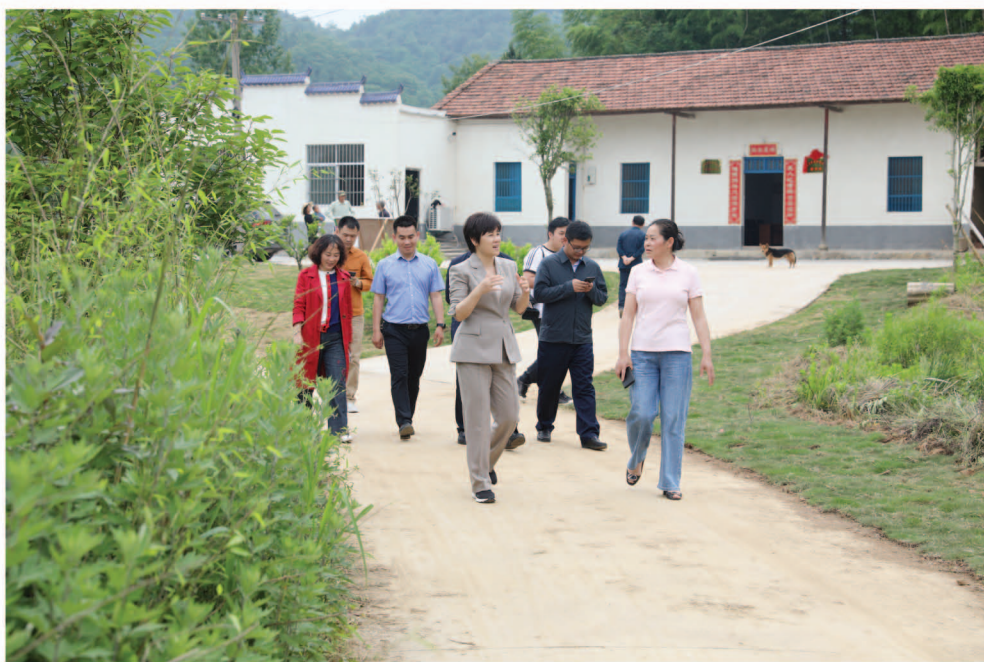
君山区主要领导调研“人大代表+点式养老”志愿服务站工作

(二)加强规划统筹，构建全方位农村养老保障体系。要推进农村养老服务设施升级。加大对农村养老服务的投入，推动公共服务资源向农村养老服务倾斜。整合日间照料中心、便民服务中心老年活动室、医务室等公共用房和农村闲置民房等资源，加强农村居家养老服务设施建设，扩大农村居家养老服务的覆盖面。要完善农村居家养老服务功能。把服务重心放在生活照料、医疗服务、精神慰藉等农村老年人最基本、最迫切、最需要的居家养老服务上，提升农村居家养老服务保障能力。要倡导农村“邻里互助”养老。采取社会捐赠、老人自筹、村民互助等方式举办农村幸福院和养老院，推行低龄、健康老人为高龄、独居、空巢老人提供家庭互助式