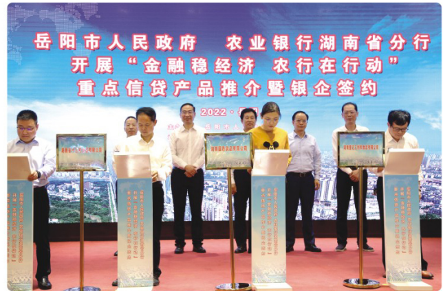
中国农业银行湖南省分行与岳阳市人民政府联合举办“金融稳经济农行在行动”重点信贷产品推介暨银企签约活动

近年来，中国农业银行岳阳分行始终坚持以习近平新时代中国特色社会主义思想为指导，紧紧围绕市委、市政府决策部署，深度融入地方经济发展大局，争做服务乡村振兴领军银行和服务实体经济主力银行。截至2023年3月末，中国农行岳阳分行各项贷款余额355.04亿元，较年初净增26.11亿元。