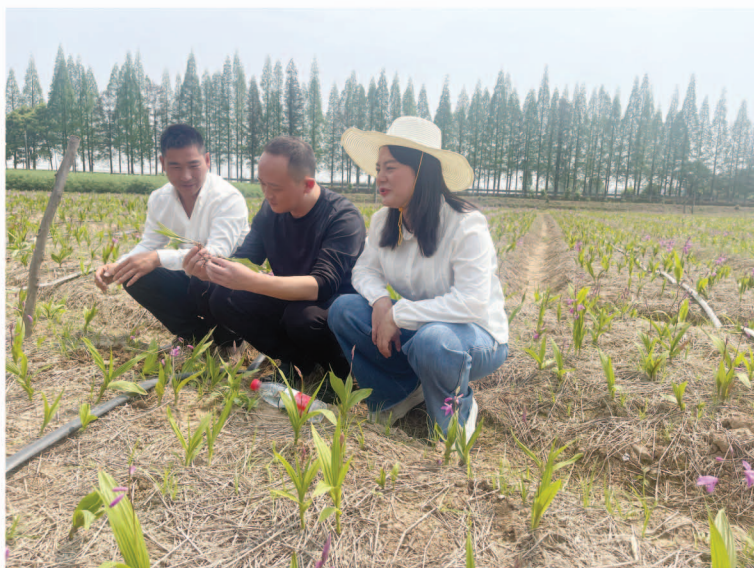
戴蜜在田间指导白芨种植

一个人赚钱没什么了不起，带动全村老百姓共同致富才是真本事。随着中药材种植技术和种植模