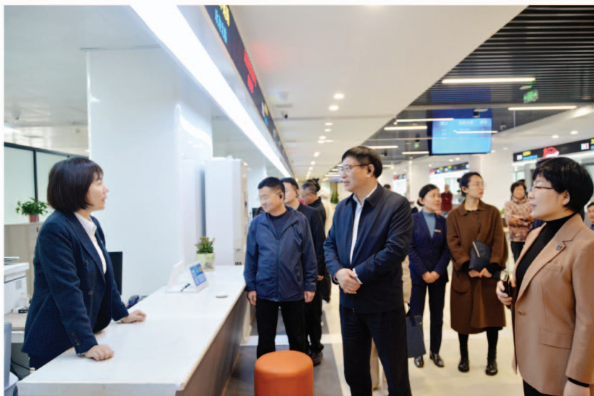
2023年3月28日区人大常委会调研行政审批改革工作

建设任务,根据《廉政风险点责任清单》定期开展风险隐患排查和研判;开展家庭助廉活动,向机关党员干部的家属发出《不忘初心 廉洁同行——家庭助廉倡议书》,号召培育、践行、传承清廉家风,构筑牢固的家庭防腐“大后方”防线;结合“书香人大”创建,积极融入清廉文化元素,构建多元清廉文化阵地,在图书阅览室设立了廉洁文化主题阅览区,精心打造了一条“算好人生七笔账”的廉政文化长廊,将廉洁从政意识渗透到机关党员干部的日常生活中,让廉政文化随处可见,廉政思想深入人心。