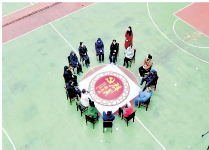
岳阳楼区“群英断是非”现场

一般人远离“是非”，他们却主动靠近“是非”； 一般人怕惹上纠纷，他们却主动调解纠纷。