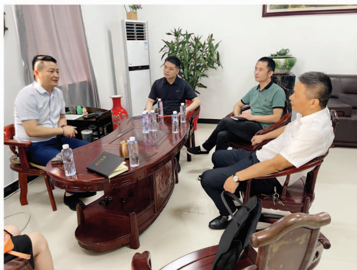
在雅彩化妆品公司调研

走在前列；市委提出了建设“三区一中心”，全力打造湖南高质量发展增长极的目标任务要求。因此，加快外经外贸发展，既是对接中央和省市工作要求，确保工作落实落地的需要，也是破解外贸工作发展难题，提高经济发展水平的客观需要。