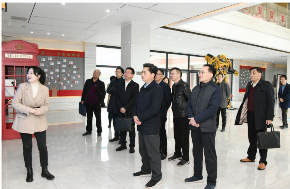
赵岳平带队在常德市武陵区第一小学考察学习

2月8日,市委书记曹普华组织召开全市议教工作会议,提出开展“重振教育雄风,建设教育强市”大调研活动。2月15日,副市长黄伟雄专程来市人大商议此事。2月23日,市委副书记、市教育工委书记汪涛主持召开大调研活动动员会。至此,由我任组长,市人大教科文卫委曹合群、李冈、徐青青,市教体局潘志扬、张金华、李