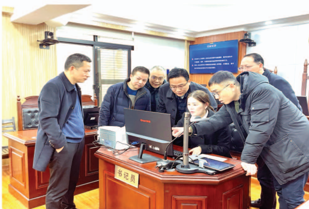
岳阳楼区人大监察和司法委员、区人大代表视察岳阳楼区人民法院智慧法庭及信息化建设

楼区监察司法委按照“件件有回音、事事有着落”的原则,摸清实情、找准症结、认真提出对策与解决办法。一是关注民生热点。因老旧小区楼宇增设电梯引发的权益损失纠纷及维权阻工问题是近年来群众信访和代表反映较突出的民生问题之一,围绕代表建议和群众呼声,区人大监察司法委进一步督促区法院加强此类案件诉前调解力度,回应群众关切;同时把司法救济作为解决此类民事纠纷案件的最后途径,妥善化解旧改纠纷。2022年8月通过湘天国际小区的电梯改造维权涉诉个案办理,形