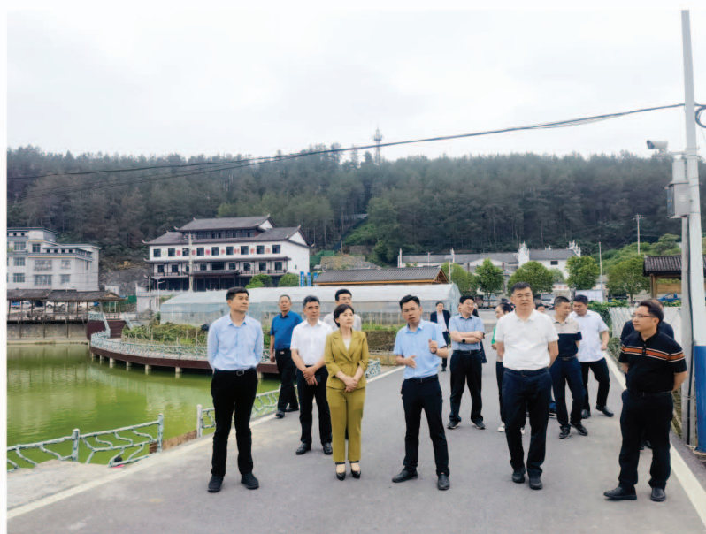
调研组在菖蒲塘村调研

作相协同,连续两年围绕促进乡村振兴、困难群体帮扶等重点工作,州县乡三级人大联动开展同主题、同时段、同规程的专题监督。围绕乡村振兴,作出关于巩固拓展脱贫攻坚加快推进乡村振兴的决定。突出粮食生产、耕地保护、人居环境整治、特色产业、壮大新型村级集体经济、人才建设、脱贫成果巩固等重点,连续两年组织集中视察,开展执法检查,推动乡村振兴各项工作落地见效。