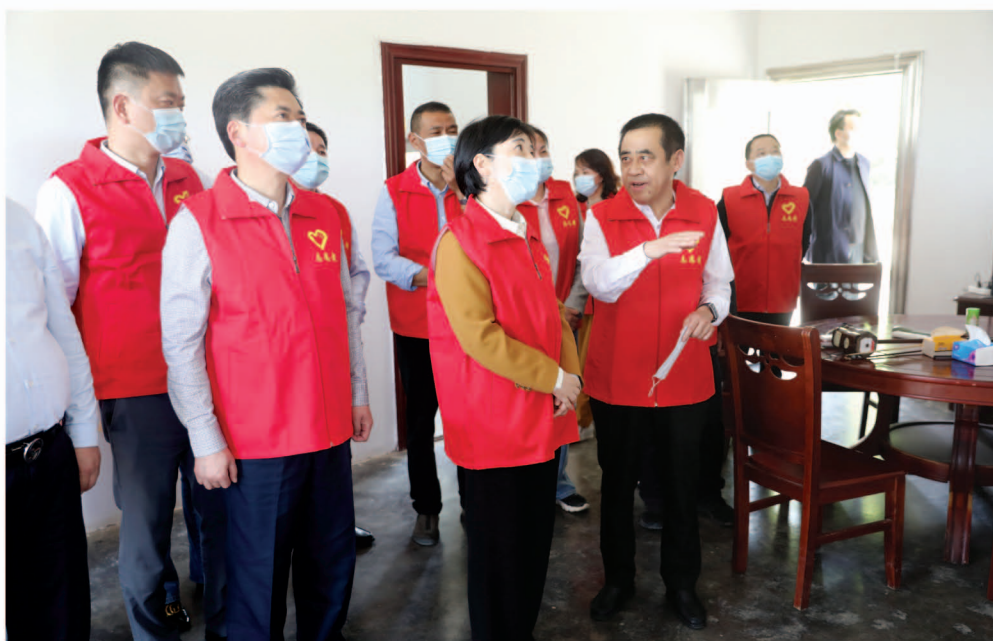
市人大常委会领导调研君山区“人大代表+点式养老”志愿服务站工作

人口老龄化是当前中国人口发展的一个热点问题,党中央把积极应对人口老龄化上升为国家战略。但农村经济基础相对较差,供养老年人能力较弱,养老服务保障体系还不够健全,农村养老服务供给与需求之间存在较大缺口。第七次全国人口普查数据显示,君山区常住人口 24.78 万人,其中 60 岁及以上人口为 4.3 万人,占比 21.57%;65 岁及以上人口为 3.2 万人,占比 16.01%。按照现行国际标准,我区已进入深度老龄化。为全面摸清农村养老服务工作需要破解的重点、难点和堵点问题,我区