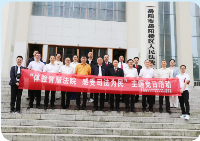
岳阳市人大常委会机关二支部开展“体验智慧法院，感受司法为民”主题党日活动