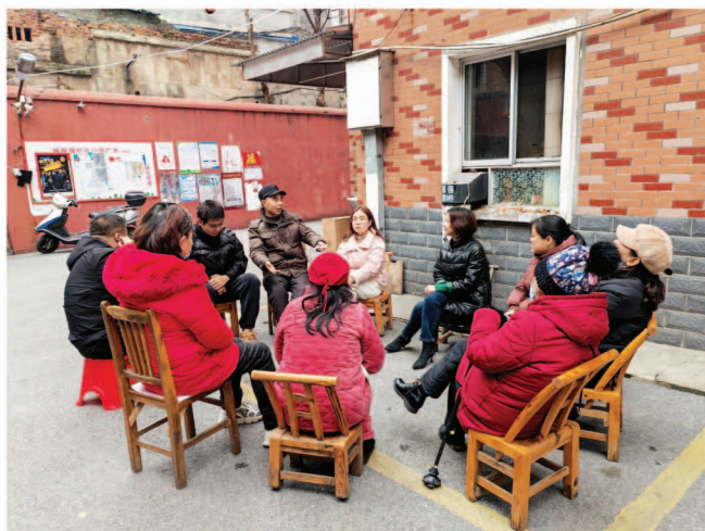
岳阳楼区五里牌街道杨树塘社区金鑫小区“群英断是非”现场

岳阳市人大常委会负责人表示，下一步要发挥好代表履职平台优势，进一步密切人大代表与人民群众的联系，积极参与、主动融入“群英断是非”工作。借鉴运用人大代表票决民生实事的经验做法，把群众的“急难愁盼”问题收集上来，让人大、政府、代表、群众的力量拧在一起，推动民生问题得到有效解决，为岳阳社会治理现代化贡献人大力量。