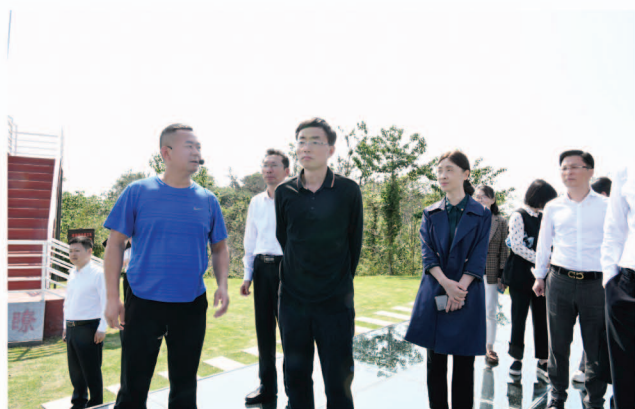
黄俊钧(左4)在华容县调研环境资源审判工作

5月22日,市人大常委会副主任黄俊钧带队赴市中级人民法院召开全市环境资源司法保护工作调研座谈会,市中级人民法院院长简龙湘陪同调研。市中级人民法院、市检察院、市公安局、市司法局等政法单位相关负责同志参会。