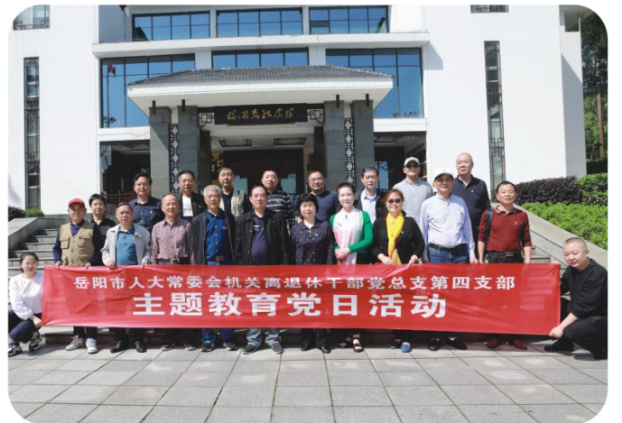
岳阳市人大常委会离退休第四支部赴杨开慧纪念馆开展主题党日活动