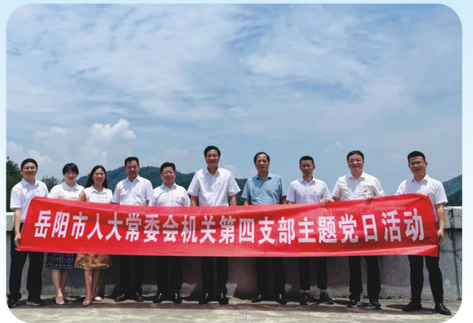
岳阳市人大常委会机关第四支部开展“保护水资源 守护好一江碧水”主题党日活动