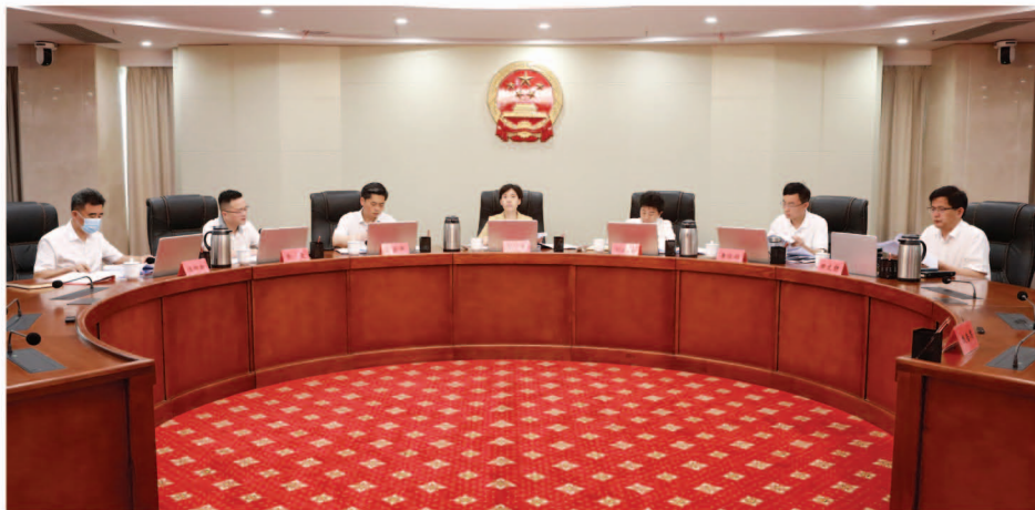
岳阳市人大常委会主任、党组书记马娜主持召开市九届人大常委会党组第28次(扩大)会议

6月2日下午,市人大常委会主任、党组书记马娜主持召开市九届人大常委会党组第28次(扩大)会议。市人大常委会副主任刘晓英、赵岳平、黄俊钧、喻文、田文静,市人大常委会秘书长汪四新参加。