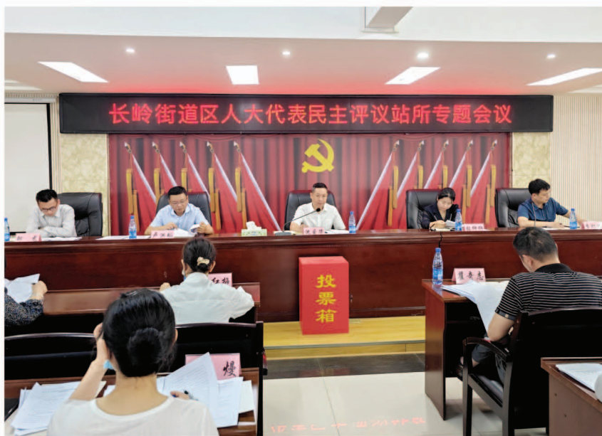
长岭街道召开人大代表评议站所会议

“接下来我们将认真梳理代表们提出的意见建议,诚恳接受、照单全收、充分吸纳、抓好整改,不断提高履职能力和为民服务水平。”长岭街道政务办公室负责人说道。会上,代表们提出了“加强业务培训和政法线工作对接”“主动办理被征地农民养老保险”“打造乡村振兴‘一村一品’”“加大卫生硬件