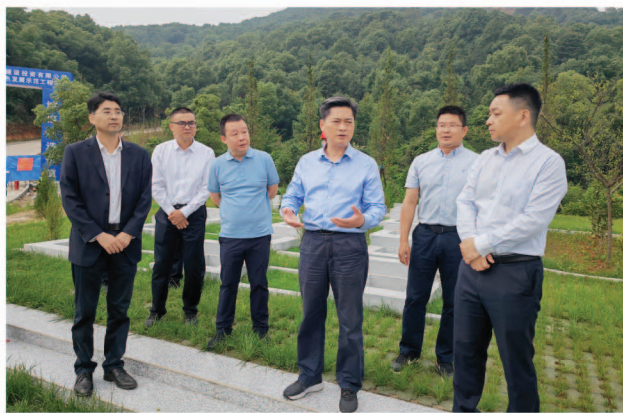
赵岳平(右3)实地察看黄茆山片区生态修改绿色发展示范工程项目

赵岳平对去年9月以来,市文旅广电局的整改落实工作取得的成绩给予充分肯定。他强调,市人民政府及文旅部门要处理好旅游旺季和全域旅游的关系,增强旅游惠民和富民功能,将岳阳打造成为“处处是景点、时时是旺季、人人是导游”的旅游目的地;要处理好恢复性增长和高质量发展的关系,进一步完善旅游产品体系,提升旅游服务水平,推进“文旅+”深度融合;要处理好竞争和配合的关系,既要引入竞争机制,又要优势互补、协作共生;既要发展周边游,又要树立精品意识,发展外地游;既要着眼洞庭