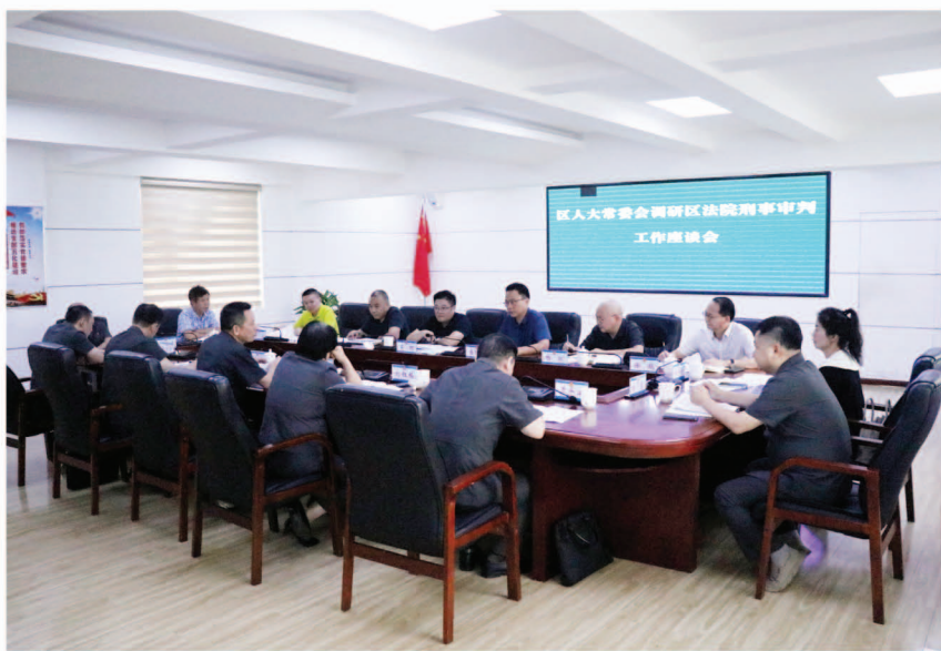
区人大调研区法院刑事审判工作座谈会

区人大顺应群众司法需求,围绕维护司法公正、提升司法绩效,依法开展正确、有效监督,全力助推法院工作高质量发展。一是坚持问题导向。近两年来,坚持把区人民法院专项工作纳入监督视野,解